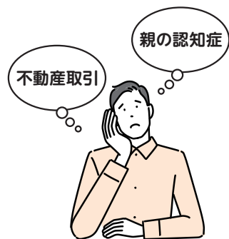
【表1】認知症になるとできなくなること（一例）

リスクは、不動産取引においても大きな影響を与えます。例えば、認知症になれば「表1」のように、アパートの管理委託契約や修繕のための請負契約の締結などができなくなります。