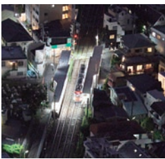
キャロットタワーの展望ロビーから、夜景の街を行く世田谷線の電車を見下ろす

世田谷区の三軒茶屋駅から下高井戸駅まで、5キロ10駅を18分ほどで結んでいるのが東急世田谷線です。乗降口が広い2両編成で、カラフルな10種類の車両が運行しています。特に人気なのが「幸福の招き猫電車」(運行は不定期で、時刻表は東急電鉄のサイトでも調べられます)。招き猫の発祥の地と言われる豪徳寺が沿線にあることにちなんでいて、猫の顔をあしらった車体がかつてもキュート。車内のつり革や床なども可愛い招き猫のデザインです。沿線では他にも世田谷代官屋敷や