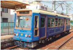
クラシックモダンな車両。他にもカラーやスタイルの異なる車両がたくさん走っている

東京都内を走る路面電車は現在2路線。一般の電車とはひと味違って、のんびりとした乗り心地やレトロ感のある風情は旅心を誘います。一日乗車券を使えば沿線の観光スポットもたっぷり楽しめますよ。