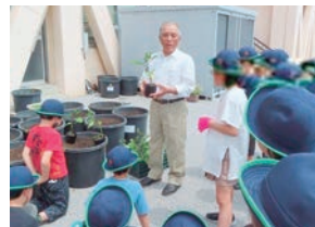
生産者の話を真剣に聞く小学生

地元の野菜を子どもたちに知ってもらい、食文化を学ぶとともに地域で受け継いでいこうという取り組みが都内各地で行われています。かつて寺島村(現在の墨田区)で栽培されていた寺島ナスは、加熱するととろみが出てとても美味しいと評判でしたが、関東大震