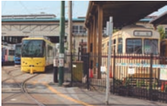
車庫の横にある「都電おもいで広場」。開場は土・日・祝日(振替休日を含む) 10:00~16:00