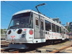
キュートな「幸福の招き猫電車」

東京に残る唯一の都電 東京さくらトラム(都電荒川線) 三ノ輪橋停留場・早稲田停留場