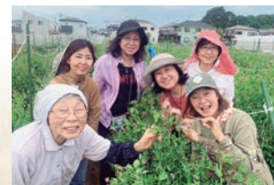
みんなで収穫! 川口エンドウ女子隊

方がいたおかげで、現在は10名前後の生産者が栽培を続けています。毎年収穫期には生産者さんたちを応援しよう! と、江戸東京野菜コンシェルジュ(※)や川口エンドウのファンが収穫のお手伝いをして農家さんと一緒に川口エンドウを守っています。