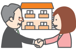
不動産の契約 賃貸・売買等