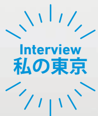
俳優、歌手 石丸 幹二さん