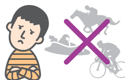
競馬・競輪・競艇