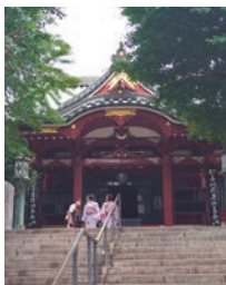
【本堂】 聖天様(しょうでんさま)と呼ばれ、古くから篤い信仰を集めている。