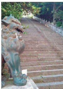
【出世の石段(男坂)】 登り切ったところに鳥居が見える。

の支院である本龍院があります。推古天皇3年(595年)、一夜のうちに湧き出た霊山を天から舞い降りた金龍が守護したことが起源と伝えられています。その後、大干ばつに見舞われ人々が苦しんでいた時に、十一面観世音菩薩の化身、大聖歡喜天が苦しむ民を救済し、それ以来、「待乳山聖天様」として信仰を集めているそうです。境内の各所には巾着や大根が印されています。巾着は財宝を表し商売繁盛を、大根は心の毒を清め身体健全、夫婦和合というご利益があるそうです。毎年1月7日に行われている大根まつり※では、聖天様に供えられた大根を調理したふるふき大根をお神酒とともにいただくことができ、多くの参拝客で賑わいます。また駐車場から本堂の横までを結ぶスロープカー「ざくらレール」が設置され、参拝客の足を助けています。